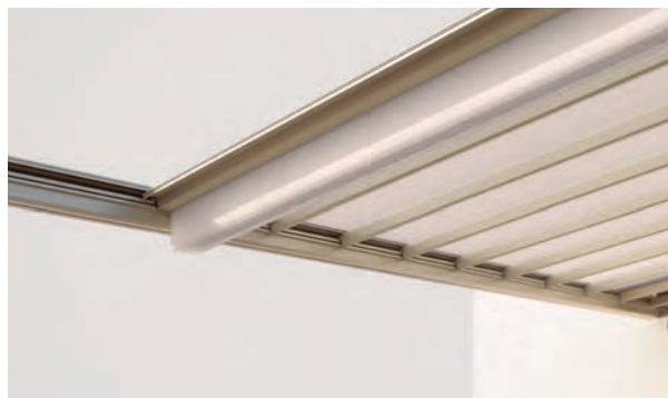
Toile dans le guidage latéral