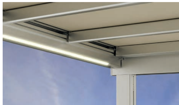
LED en option